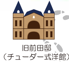
旧前田邸 (チューダー式洋館)