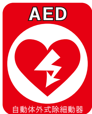
自動体外式除細動器